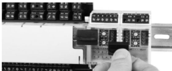
Рис. 2. Подключение модуля расширения к ПСК-1215

Установка и наладка устройства должны производиться только квалифицированными специалистами, при соблюдении всех действующих технических требований и норм, включая требования настоящего руководства.