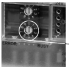
Рис. 3. Селектор адреса модуля расширения

Назначение адресов модулей расширения производится с помощью переключателя адресов x1 на передней панели корпуса модуля расширения.